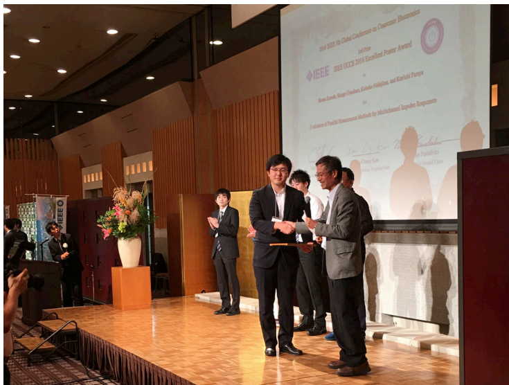
表彰式の様子(学会のバンケットにて)

今回の国際会議でポスター発表された 89 件の論文の中から 6 件が Excellent Poster Award として表彰され, その中の3位となりました。研究内容やポスター発表でのプレゼンテーションが認められて今回の受賞に至りました。